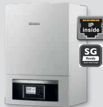
Momoenergetická/bivalentná vnútorná jednotka pre montáž na stenu