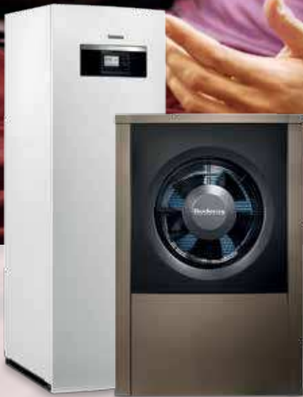
Logatherm WPL AR

Buderus Tepelné čerpadlo vzduch/voda Výkonový rozsah: 2 – 14 kW