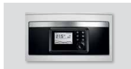
Regulačný systém Logamatic EMS plus: užívateľské rozhranie Logamatic HMC 300

Aplikácia EasyControl umožňuje ovládať Váš vykurovací systém jednoduchšie, pohodlnejšie a intuitívnejšie ako kedykoľvek predtým (iOS alebo Android). A to všetko vďaka regulačnému systému Logamatic EMS plus, zabudovanému internetovému rozhraniu a užívateľského rozhrania Logamatic HMC 300.