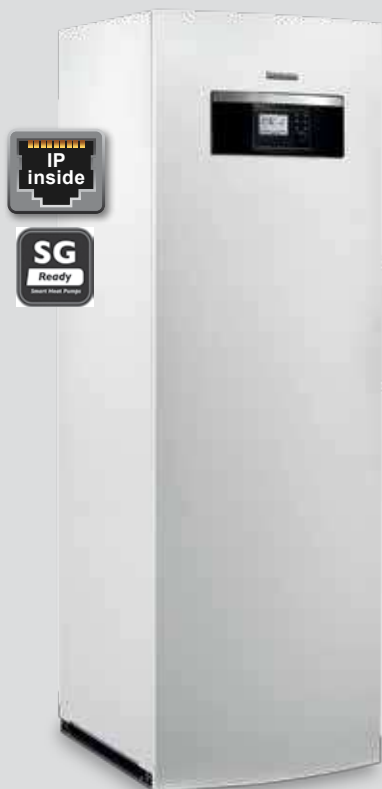
Monoenergetická vežová vnútorná jednotka s integrovaným zásobníkom teplej vody