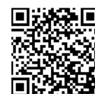
EasyControl pre iOS